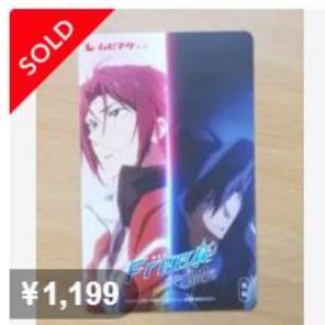
【番号のみ】 劇場版 Free the final stroke 後編 ムビチケ