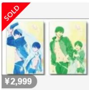
Free! ムビチケ 前売特典 クリアファイル 第3弾 七瀬遙 遙 橘真...