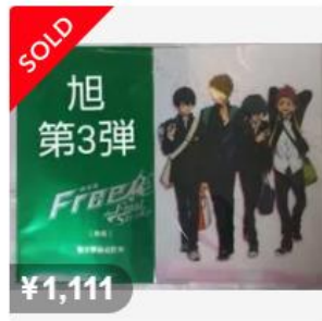
Free! ムビチケ 前売特典 3弾 クリアファイル ハイスピード 椎...