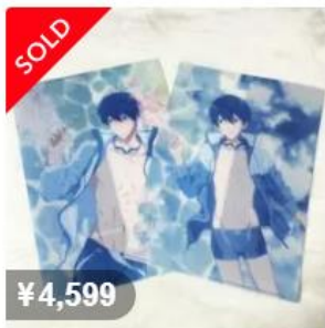
七瀬遙 クリアファイル