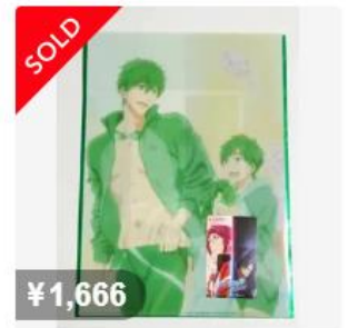
Free! 後編 第3弾 ムビチケクリアファイル 橘真琴