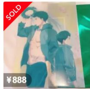
Free! 後編 山崎宗介 ムビチケ 特典 クリアファイル