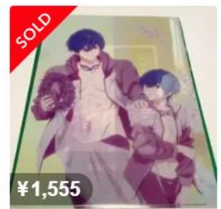
桐嶋郁弥 クリアファイル