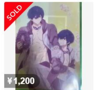
桐嶋郁弥 クリアファイル Free! ムビチケ特典