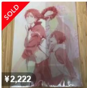
free 後半 劇場版 ムビチケクリアファイル