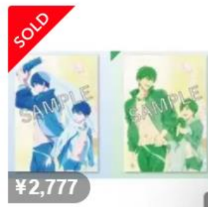
Free! ムビチケ 特典 遙 真琴