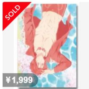
Free! ムビチケ 前売特典 第2弾 クリアファイル 松岡凜 凜