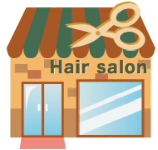
楽天ビューティ掲載店